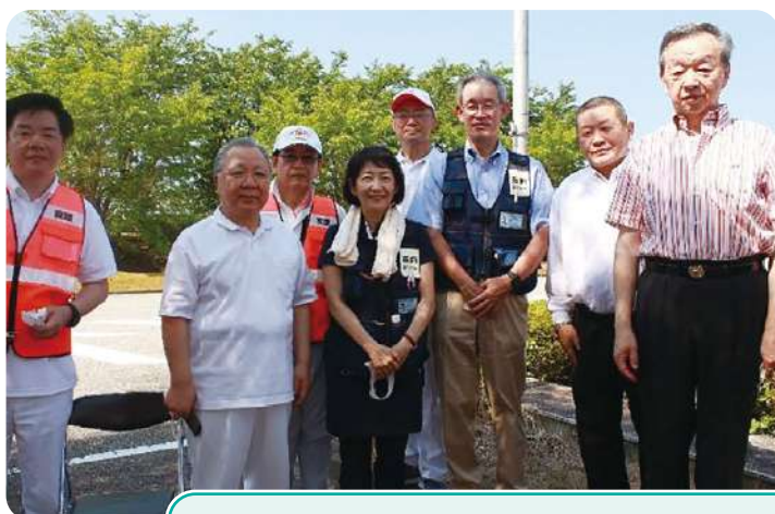
富山県JMAT役員の皆様と会長・副会長・災害対策委員長